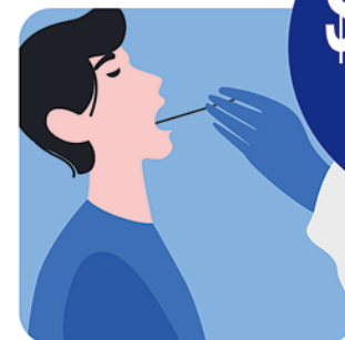
深喉 Oral cavity & saliva